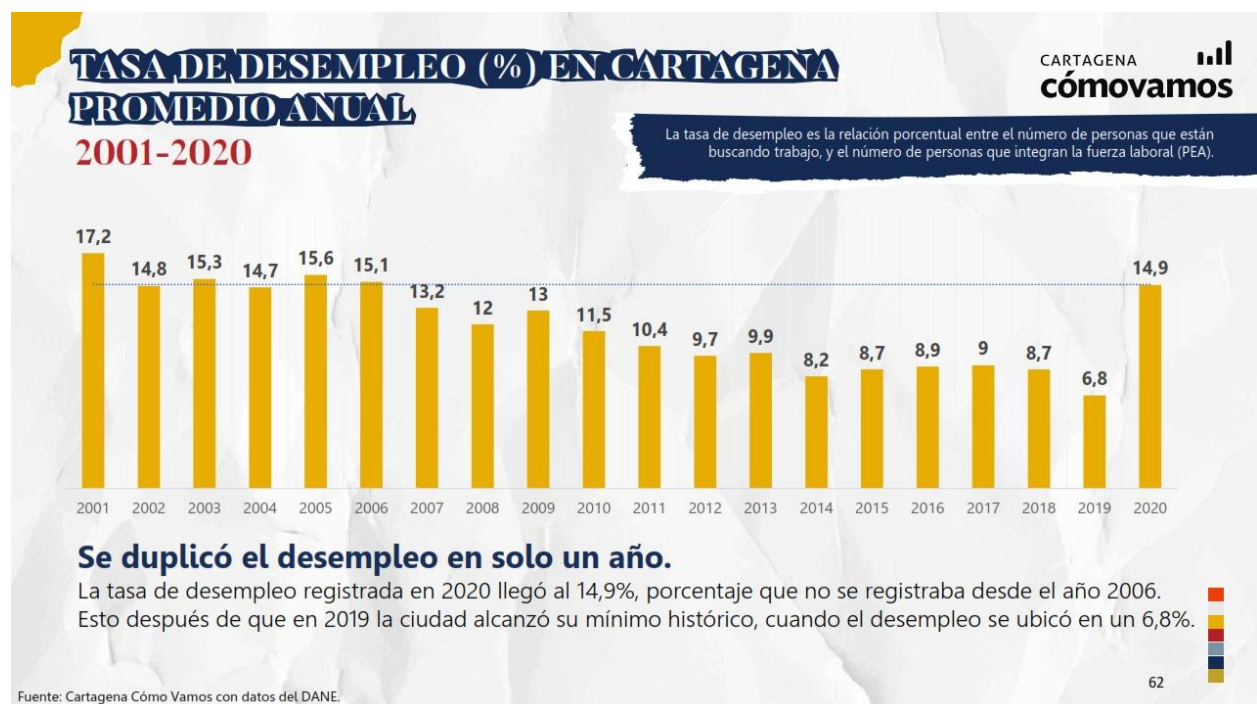
Grafica No. 2. Tasa de desempleo en Cartagena.

Contrario a lo anterior encontramos con respecto al desempleo en la ciudad lo siguiente: