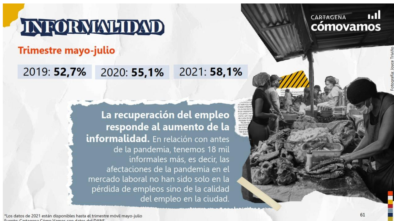
Grafica No. 4. Informalidad en Cartagena.

En base a lo anterior se puede concluir que de cada diez (10) vehículos matriculados, seis (6) son motos. La siguiente infografía trata el tema de la informalidad en la ciudad: