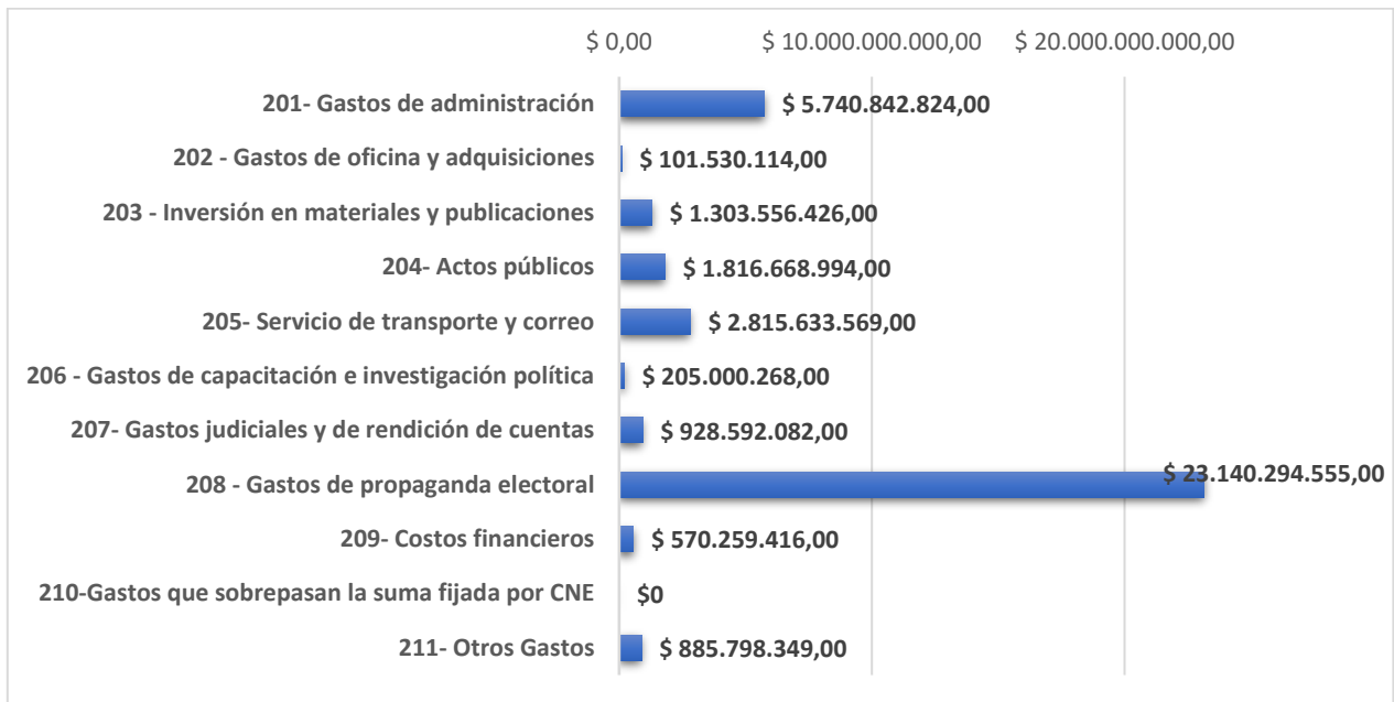
Gráfica 4. Gastos de los candidatos a las consultas interpartidista