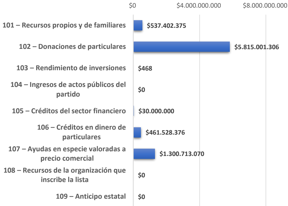
Gráfica 5. Ingresos Comités Promotores Elecciones Presidenciales 2022