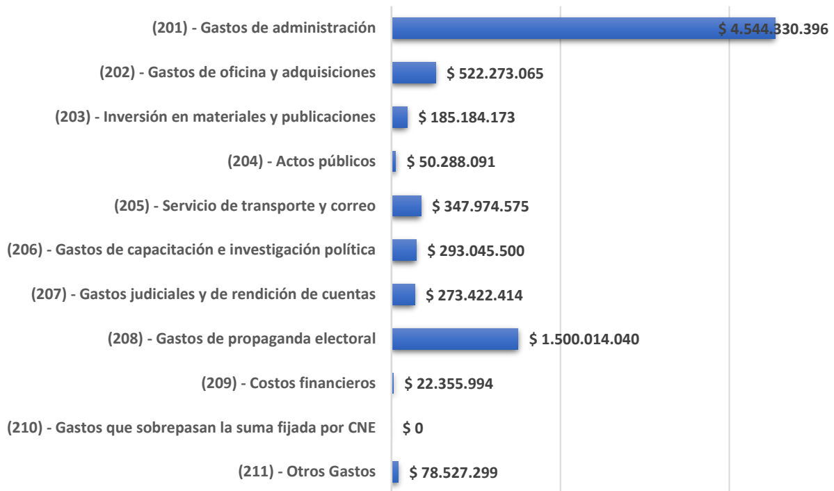
Gráfica 6. Gastos Comités Promotores Elecciones Presidenciales 2022