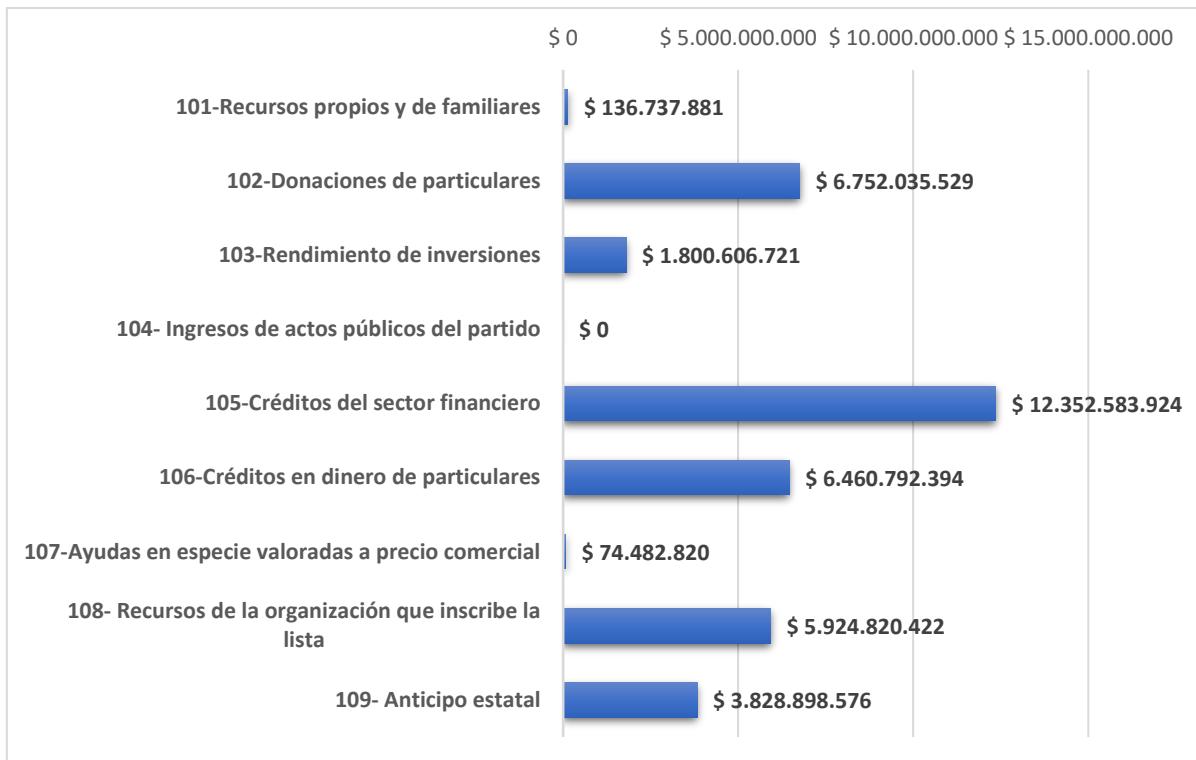
Gráfica 3. Fuentes de ingresos de los candidatos a las consultas interpartidistas