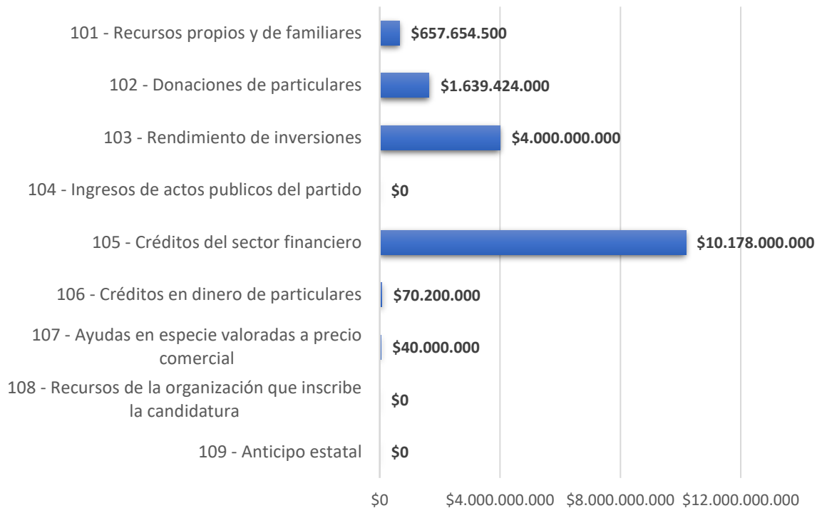
Gráfica 1 Ingresos reportados por los candidatos a la Presidencia 2022-2025

Fuente: Elaboración propia a partir de los datos reportados en Cuentas Claras