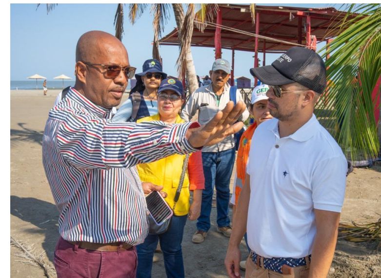
Ilustración 3. Bajamar – La Boquilla/ 27-02-2023