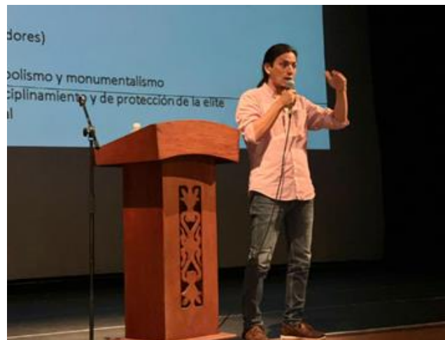
Ilustración 2. Primer clase Diplomado en Derecho Urbano / 22-11-2022

***En 2023 se contempla realizar otro diplomado en Derecho Urbano