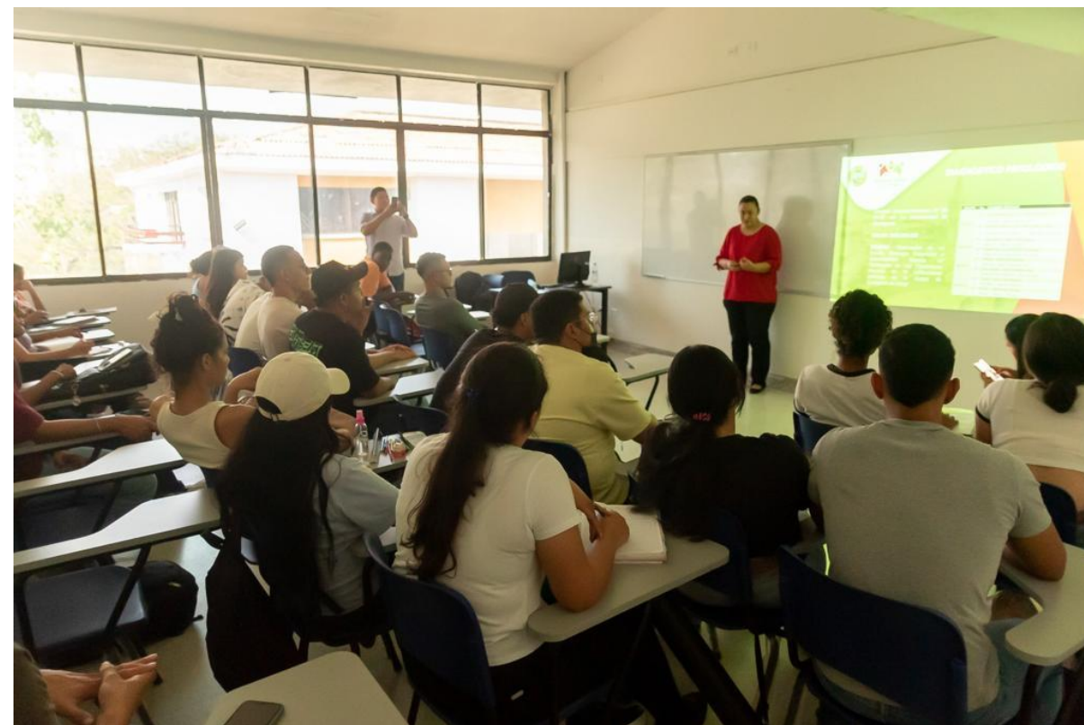
Ilustración 1. Estudiantes de arquitectura de la U. San Buenaventura /presencial/ 01-03-2023

***Las capacitaciones iniciaron desde el 01 de marzo 2023