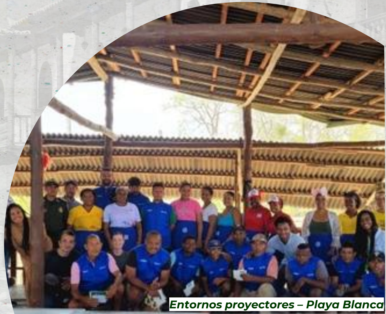
Entornos protectores – Playa Blanca