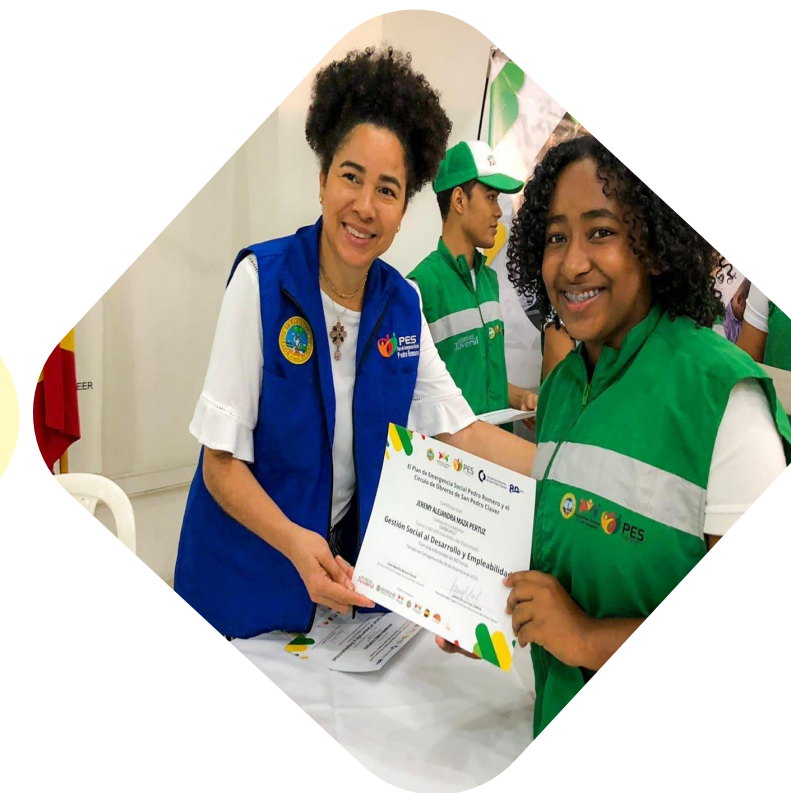
Ingreso y Trabajo