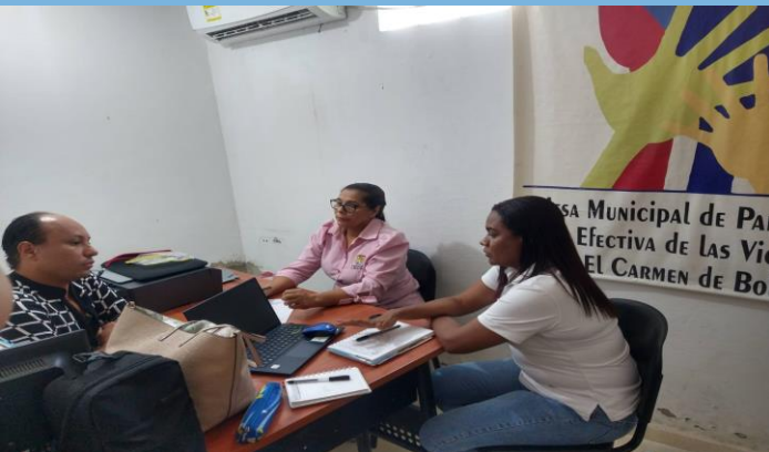
Asociación Población Diversa Víctimas para la construcción de la Paz, El Carmen de Bolívar.