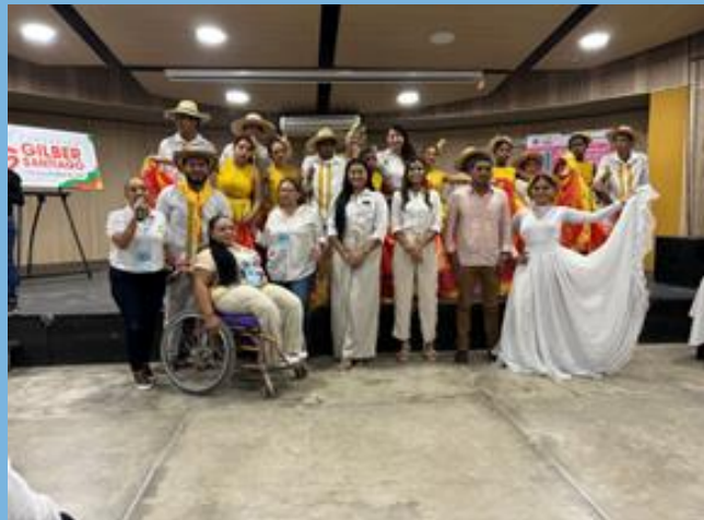
Validación de la Política Publica de Discapacidad- Magangué.