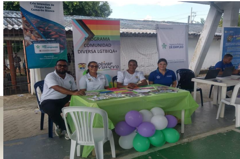
Registro de hojas de vida e Inscripción de Proyectos Productivos en San Juan Nepomuceno