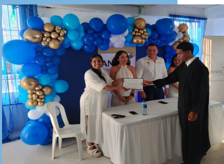
Clausura de talleres de emprendimiento Hogares Claret.