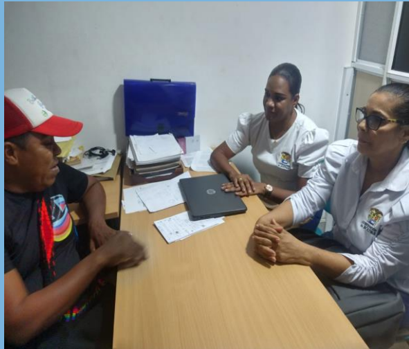
Representante Corporación Santa Rosa Respetuosa.