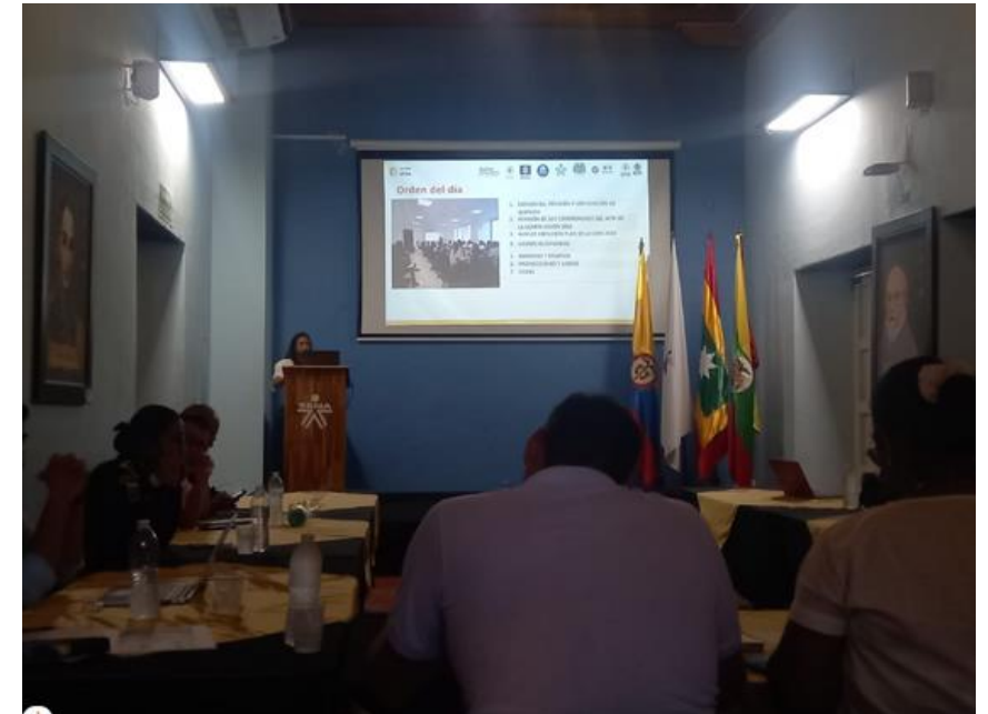
Comité Departamental de SRPA