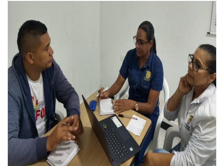
Enlace Municipal Municipio de Magangué