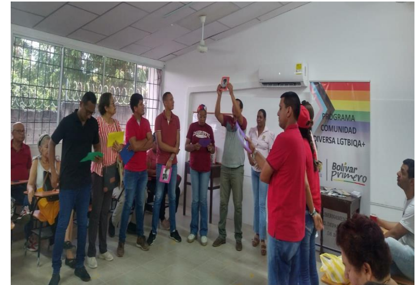
Taller de Sensibilización con docentes en el municipio de San Estanislao de Kostka.