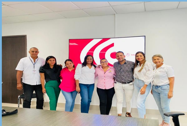
Asistencia Técnica Ministerio de Interior