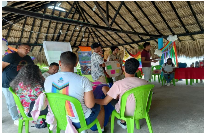
Revisión de la Implementación de la Política Pública De Diversidad Sexual y Genero - Turbaco