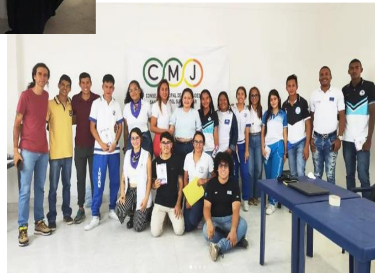
Consejos Municipal de Juventudes