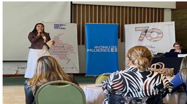
Encuentro Nacional de Cuidadores - Bogotá