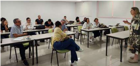
Reunión 1 campañas Gobernación, previo a debate del 18 de octubre.