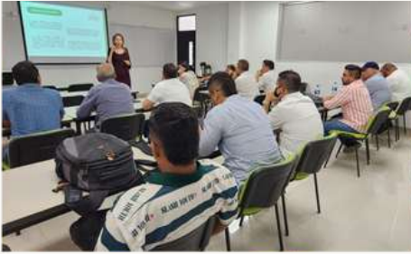
Reunión 1 con campañas a la alcaldía, debate ciudadano del 26 de septiembre.