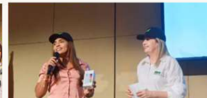
Rifas y sorteos para asistentes