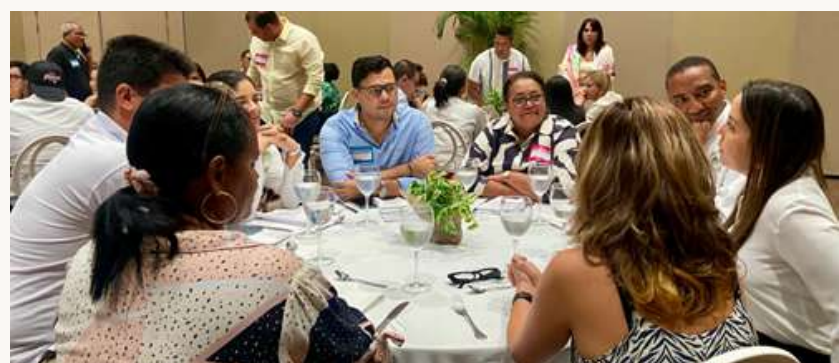
Almuerzo de integración entre todos los sectores