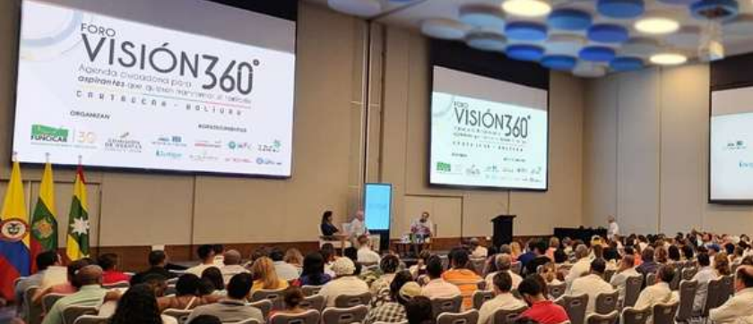
Auditorio Aguamarina Hotel Intercontinental Cartagena de Indias