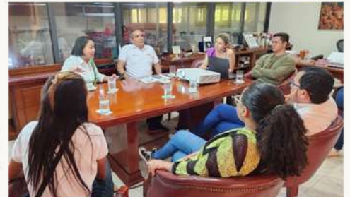
Reunión 2 campañas Gobernación, previo a debate del 18 de octubre.