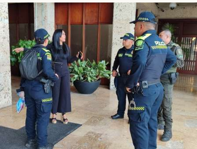
Presencia de la Policía Metropolitana de Cartagena para garantizar seguridad.