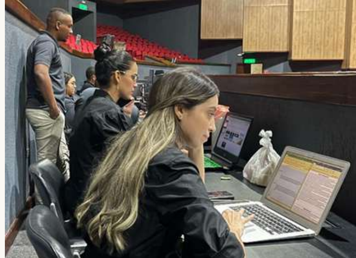
Equipo humano para la transmisión – alianza medios CDPB