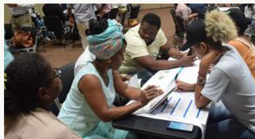
Mesas de trabajo para proponer un modelo de desarrollo local