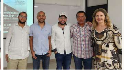
Reunión con campañas a la alcaldía, previo a debate final 18 de octubre.