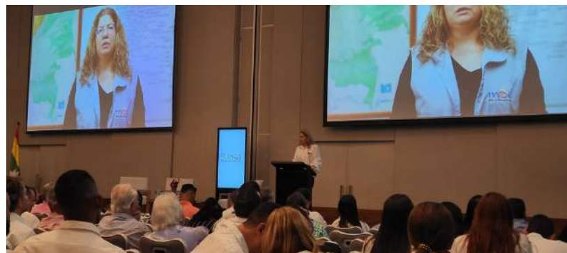
Mensaje de la Misión de Observación Electoral para las campañas de Cartagena y Bolívar Alejandra Barrios - Directora MOE Colombia