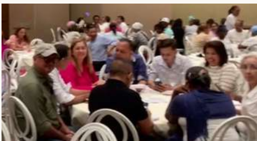
Almuerzo de integración