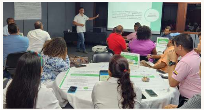
Jornada de alistamiento para el encuentro.