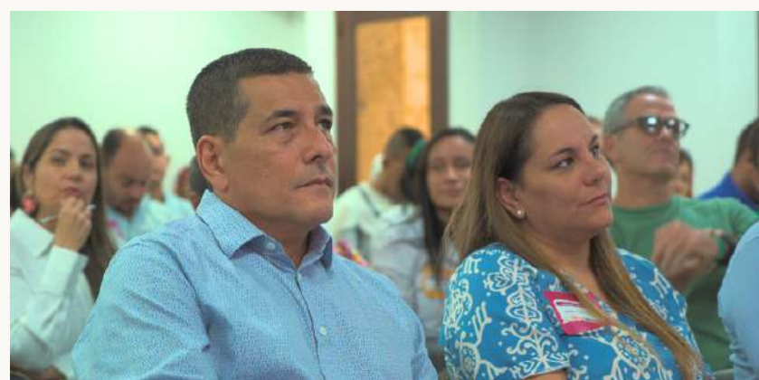
Equipo alcalde Dumek Turbay Paz