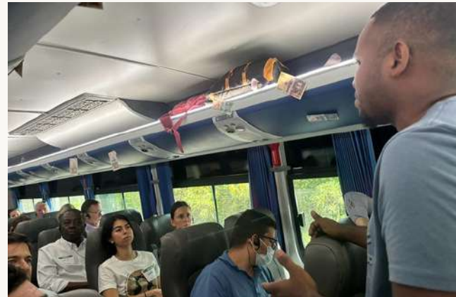
Imágenes tomadas del Corruptour con equipo directivo DAI y USAID.