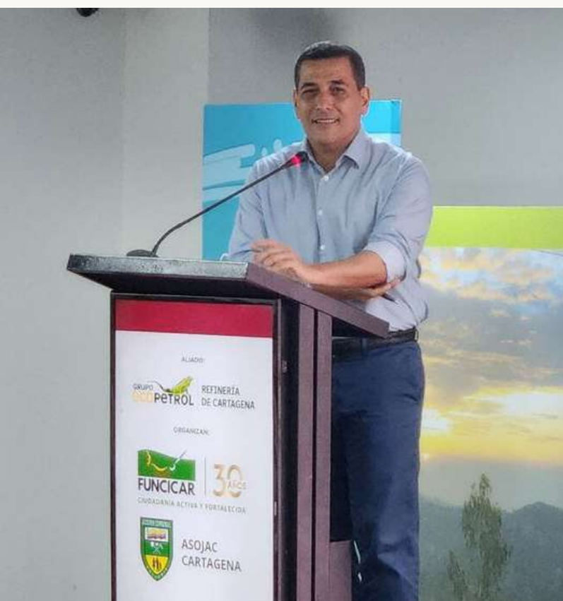
Palabras del alcalde electo, Dumek Turbay Paz