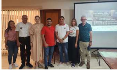
Reunión 2 con campañas a la alcaldía, debate ciudadano del 26 de septiembre.