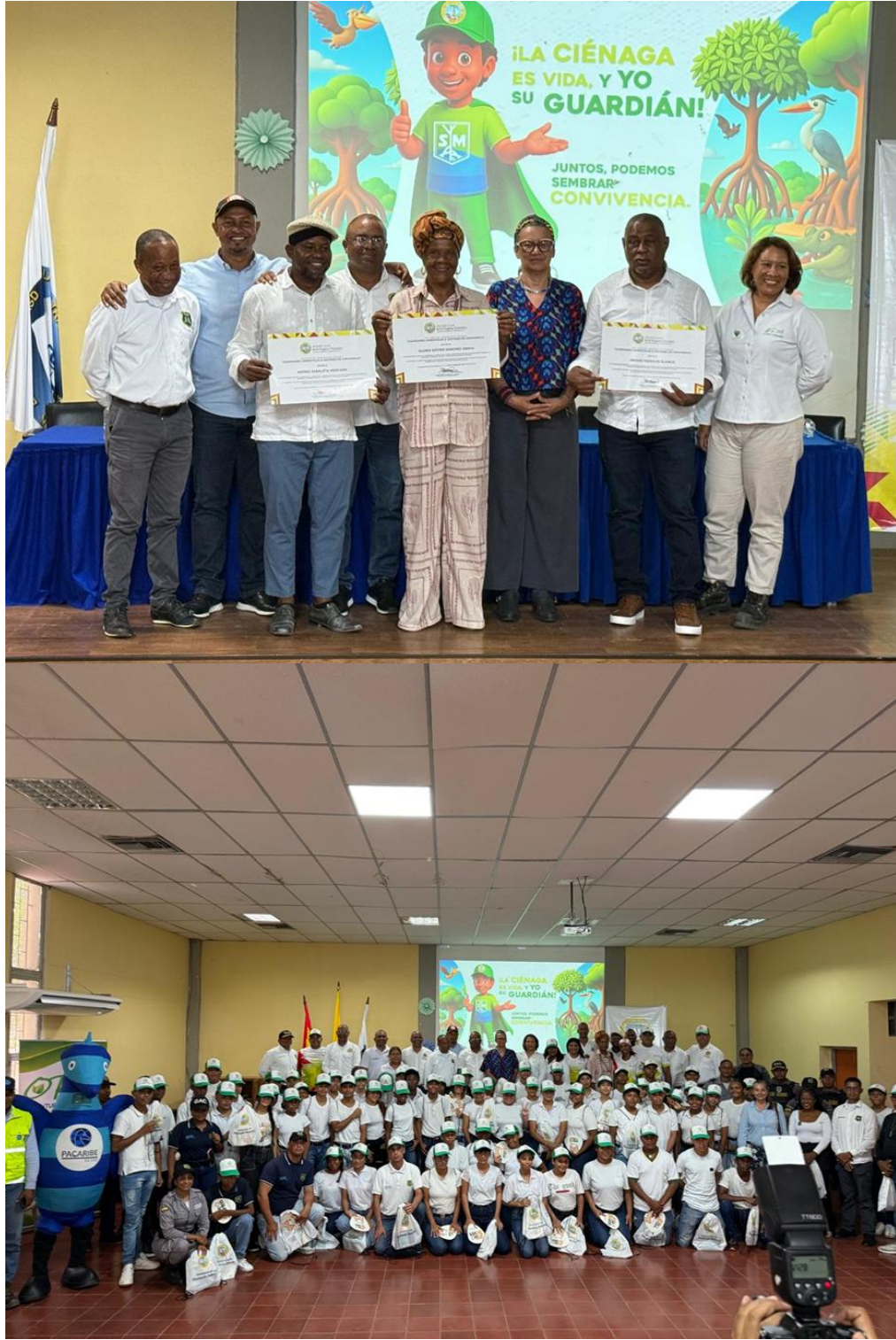
Lanzamiento del proceso de formación de 100 Guardianes Juveniles ambientales