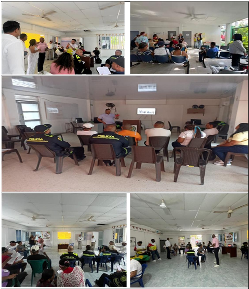
166 personas, sensibilizadas en torno a la prevención de las violencias basadas en género y en convivencia ciudadana