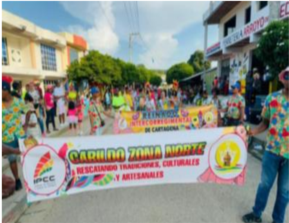
Apoyo en la realización de 1 Cabildo en la Zona Norte en Manzanillo del Mar.