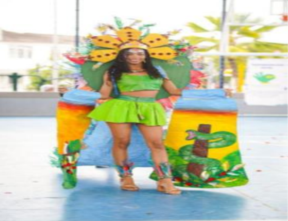
Realización del Primer Festival Ecológico Distrital.