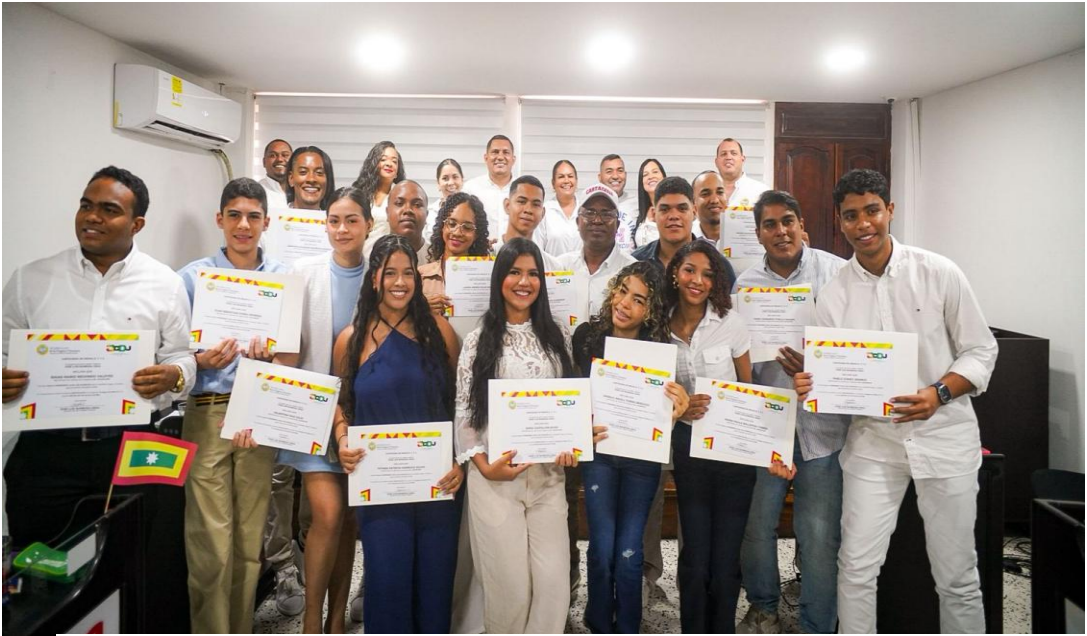
POSESION REPRESENTANTES DEL COMITÉ LOCAL DE DISCAPACIDAD