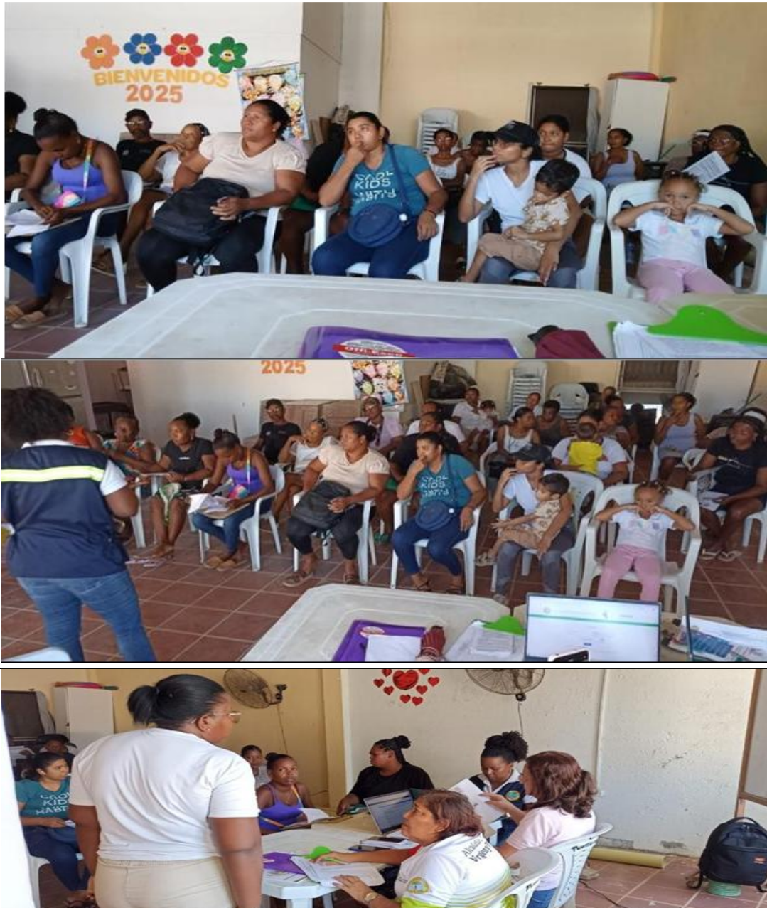
Asesoría a 60 personas con discapacidad y sus cuidadores.