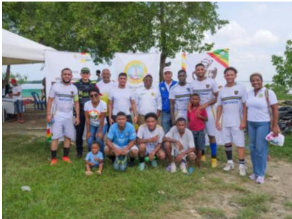
Realización del evento deportivo “Torneo de Valores”, en el Mes por la Paz.