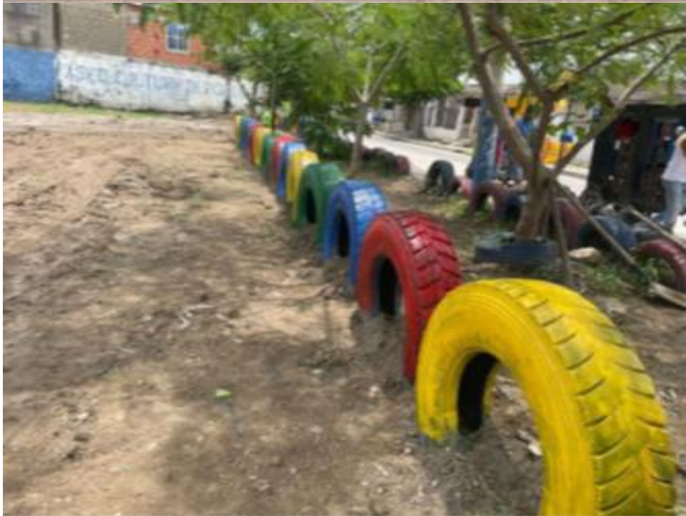
Eliminación de tres (3) basureros satélites en la Localidad