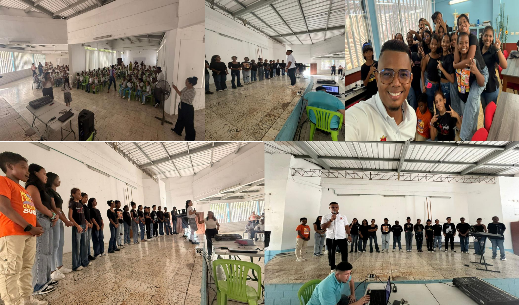
Formación en técnica vocal a 30 niños y niñas de la IEO Las Gaviotas