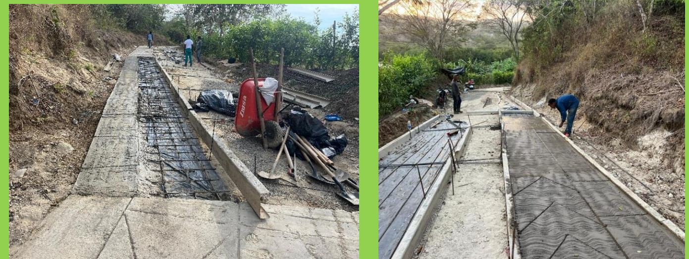
PLACA HUELA – PUA - CORR ARROYO DE PIEDRA