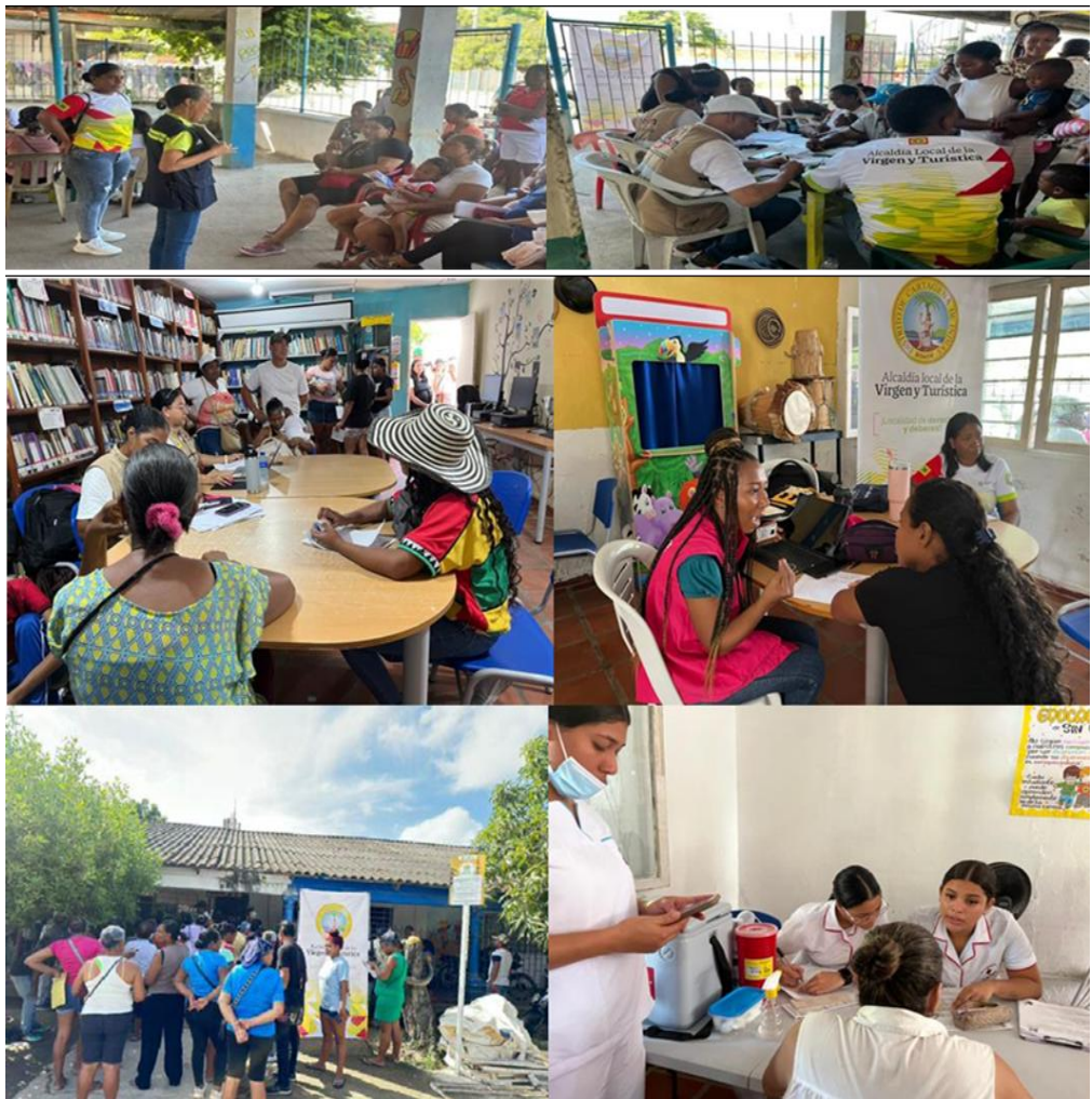
Desarrollo de ocho (8) jornadas de oferta institucional: "ALCALDÍA EN EL BARRIO"