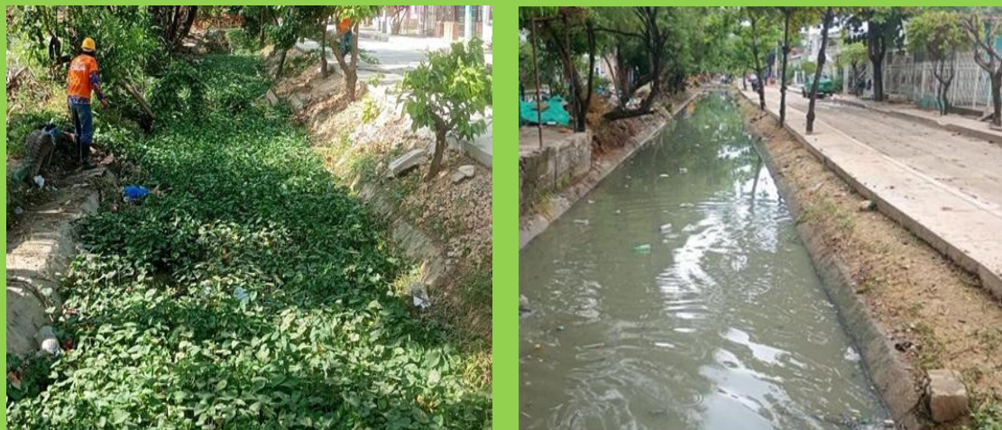
CANAL CALICANTO VIEJO