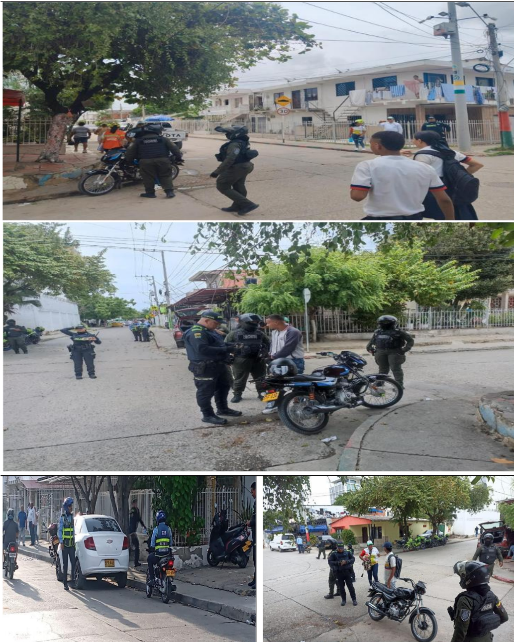
Realización de 6 campañas de sensibilización sobre el control vial.