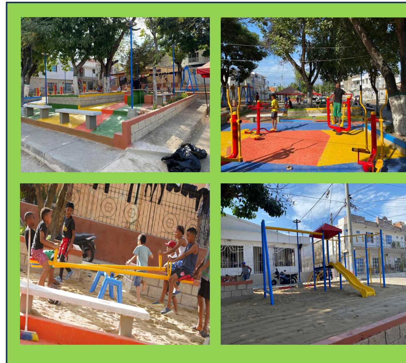
PARQUE BARRIO CHIQUINQUIRA