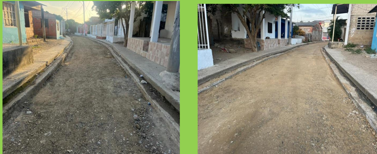
PAVIMENTACION – CORR ARROYO DE PIEDRA - CR 5