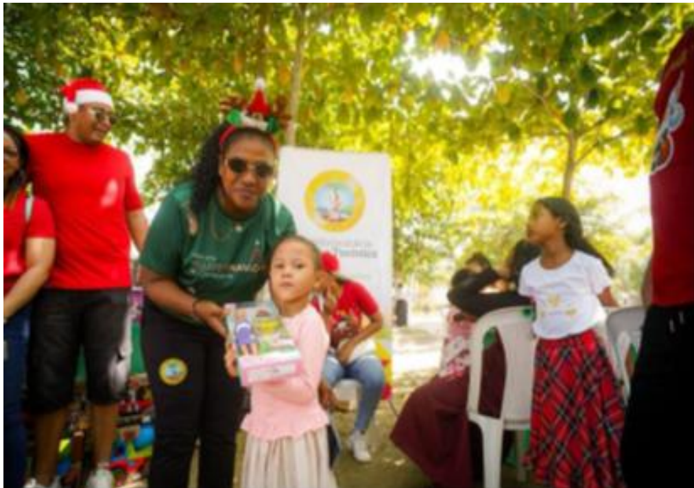
Jornada de integración navideña, beneficiando a 450 niños y niñas de la Localidad.