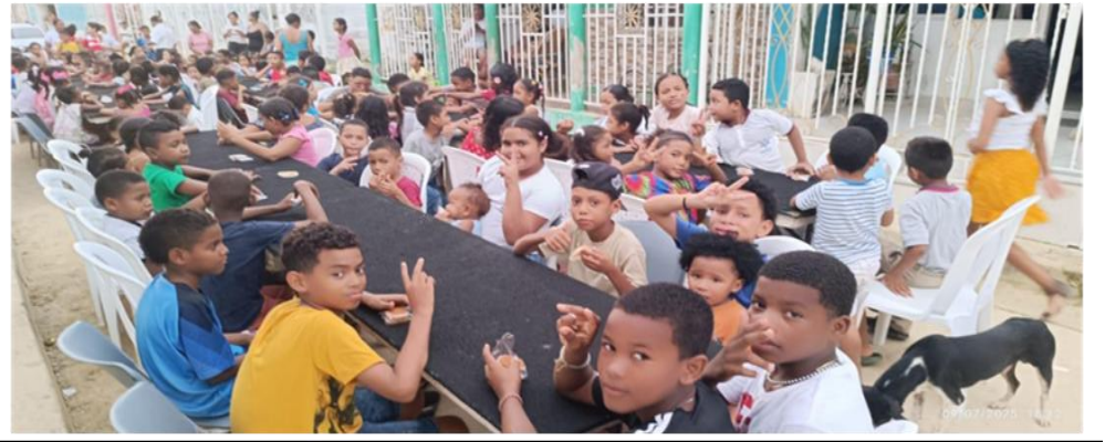
1.972 niños y niñas en pobreza extrema beneficiadas con kit alimenticios