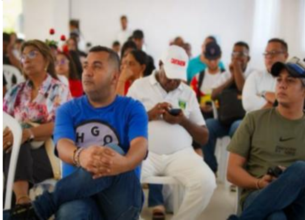
Realización de rendición pública de cuentas