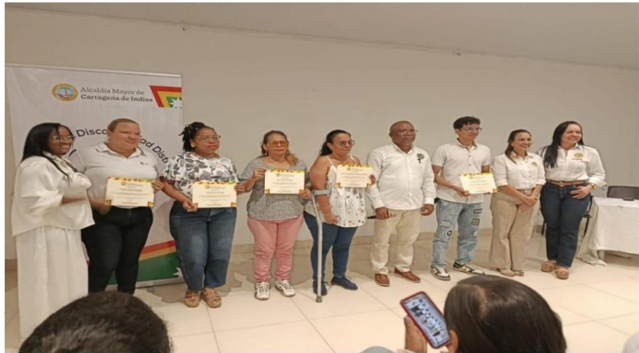
Elección del Consejo Local de Juventud Elección del Comité Local de Discapacidad