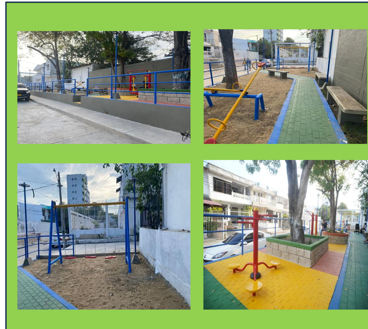
PARQUE BARRIO LAS GAVIOTAS