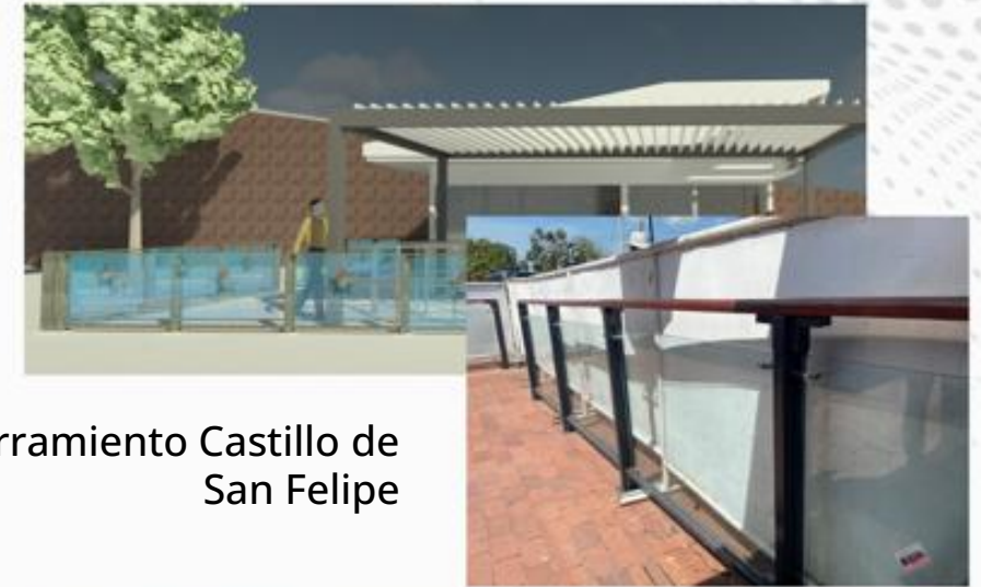
Cerramiento Castillo de San Felipe