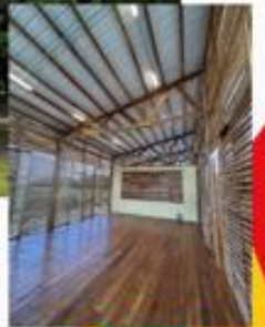
Aula Fuerte de San Fernando Bocachica