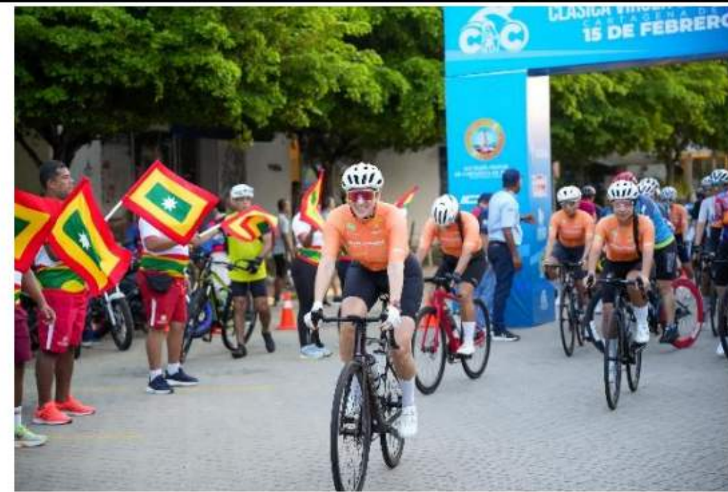
Clásica de Ciclismo – Virgen de la Candelaria