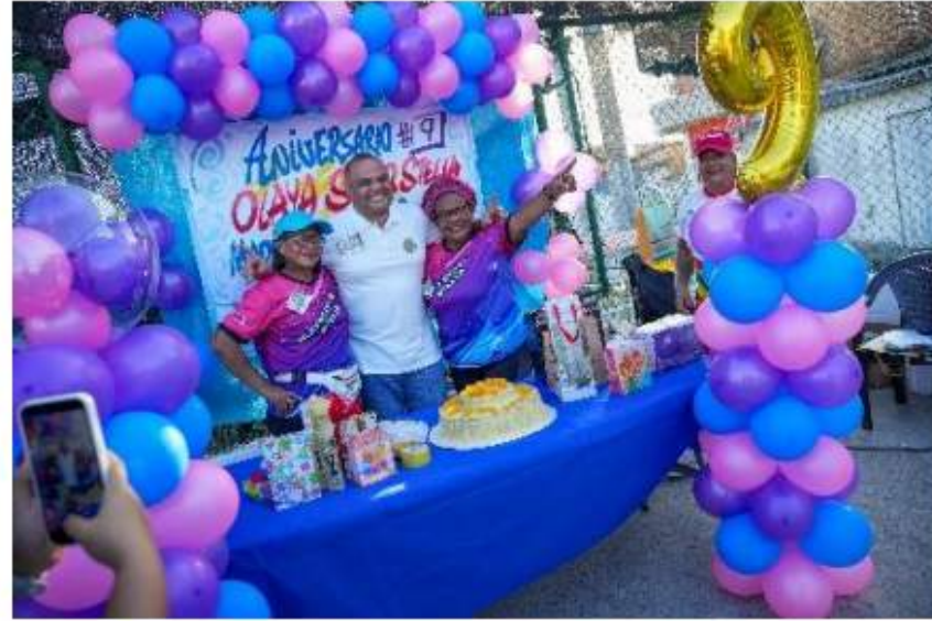
Aniversario N° 9 de punto de actividad física Madrúgale a la Salud – Olaya Sec. Stella.