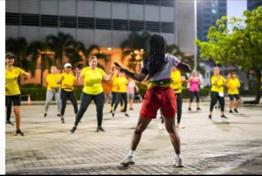
Madrúgale a la Salud – Punto de Actividad física de Manga