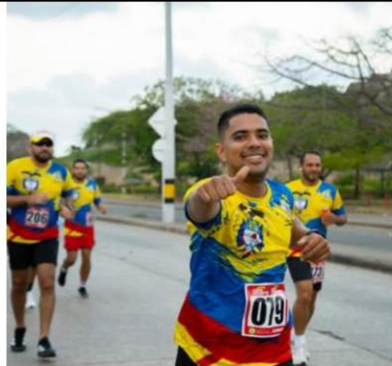
Running 6k – Copa Candelaria